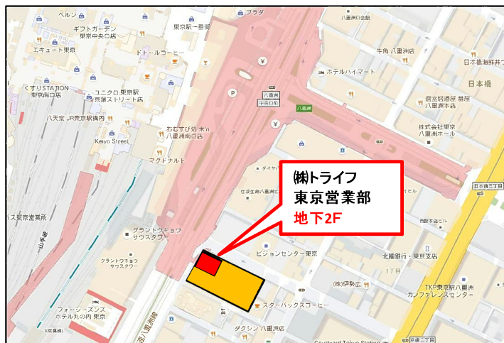
東京駅八重洲南口