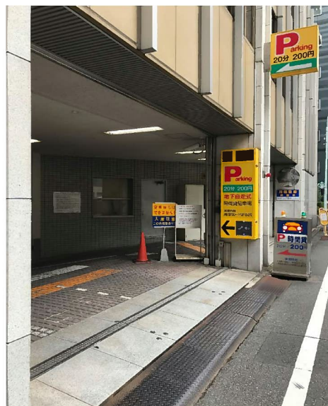
駐車場入口（地下2階へ）